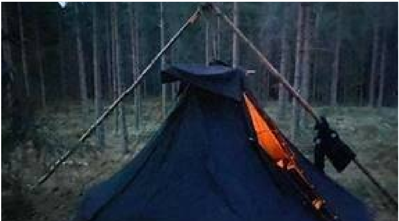
Die „Eisvogel“-Pfadfinder werben um Verstärkung.

22. August 2021 um 11:34 Uhr | Lesedauer: 2 Minuten